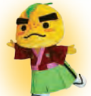
箕面市 滝ノ道ゆず(1/13)