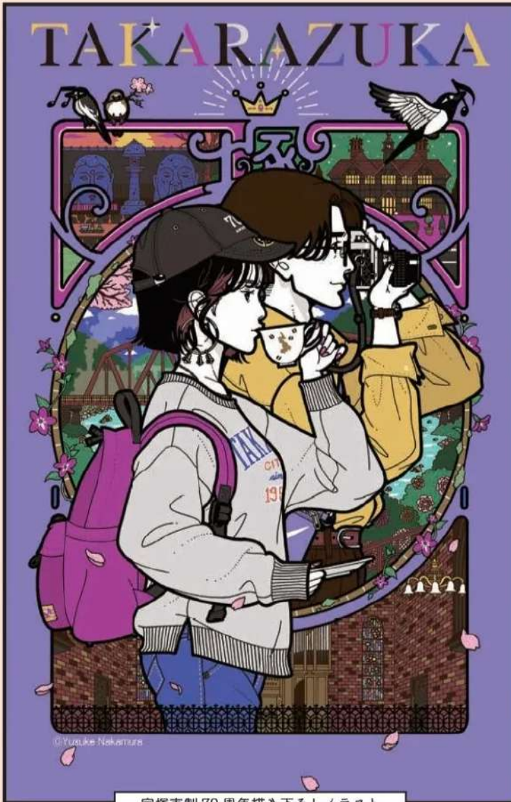
宝塚市制70周年描き下ろしイラスト